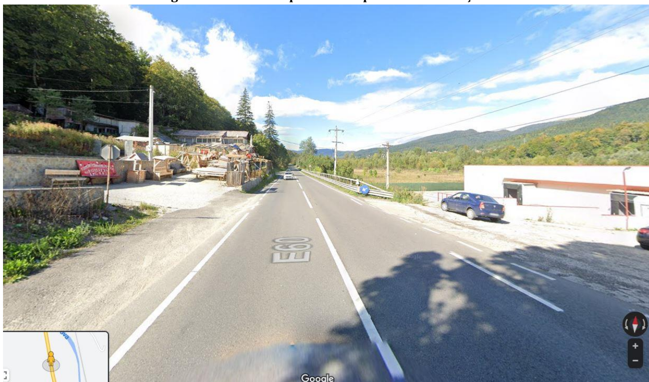
Figura 2. Vedere incepere traseu pe DN1 - UAT Bușteni

De asemenea trebuie menționat faptul că zona studiată este traversată de drumuri locale, care se vor intersecta cu accesul rutier complementar pentru descarcare A3, intersecții care vor trebui amenajate corespunzător.